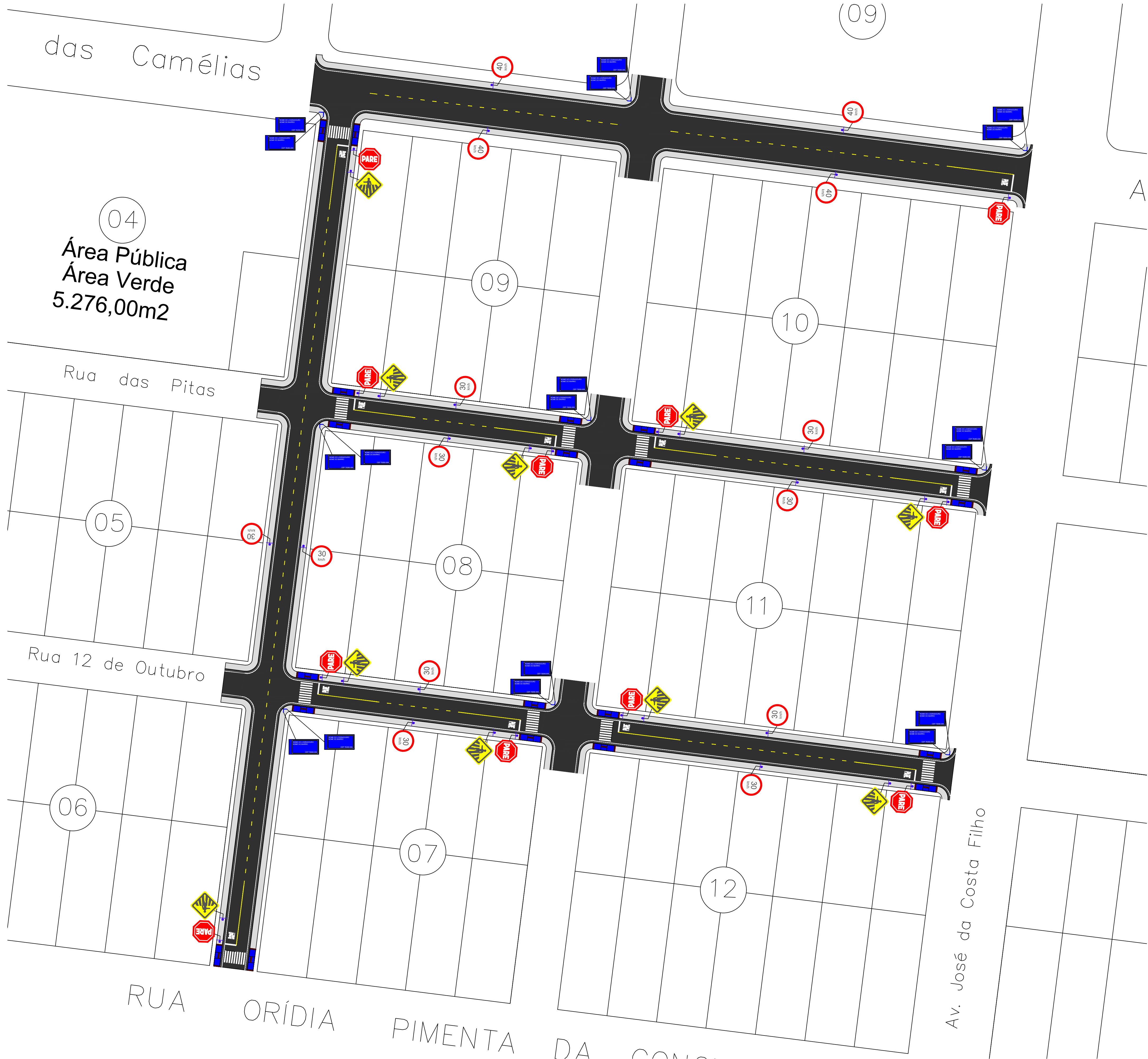
PLANTA LAYOUT SINALIZAÇÃO ESCALA 1:500