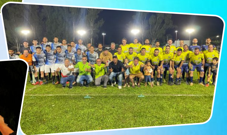
Jogos e Campeonatos Locais para População