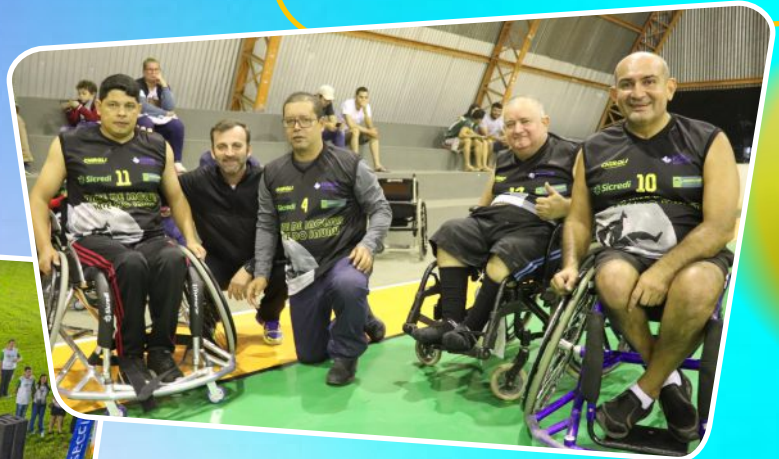
Esporte com Acessibilidade