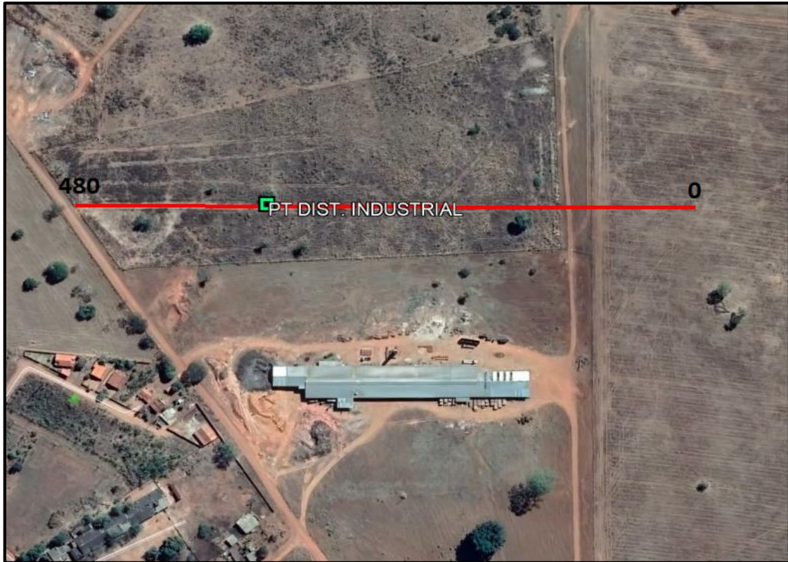
Figura 04 – Croqui de localização do Caminhamento Elétrico 1